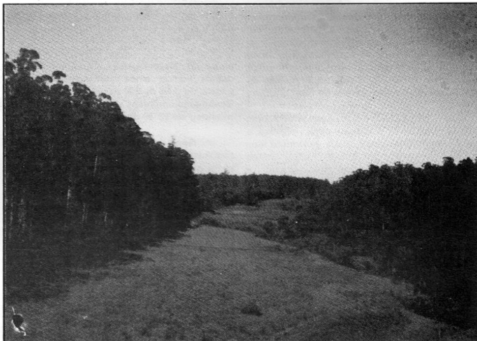
Vista parcial do Horto Florestal de Itatinga

No último dia 12 de junho foi firmado um convênio entre a Prefeitura Municipal de Itatinga e a USP, através da ESALQ, visando a instalação e manutenção de um viveiro de mudas de essências florestais. Fundamentalmente, o viveiro deverá formar mudas de nativas e exóticas destinadas a trabalhos de reflorestamento de pequenas propriedades, recuperação de matas ciliares, áreas degradadas e arborização urbana. Além disso, e sob a supervisão do Departamento de Ciências Florestais, deverá ser treinada mão-de-obra especializada na área florestal, de acordo com o interesse da Prefeitura. Deverá também fornecer mudas e assistência técnica aos proprietários agrícolas da região.