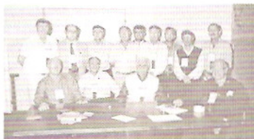
Momento de Trabalho: A equipe organizadora da V Conferência