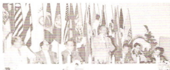
Momentos de Trabalho: Governador Sogayar abrindo os trabalhos