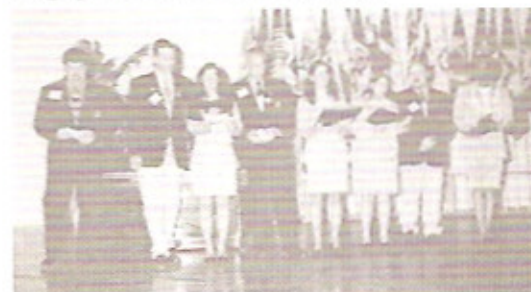
Momento de confraternização: Grupo de IGE do 4310 e de IGE do 6460 de Illinoss, EUA