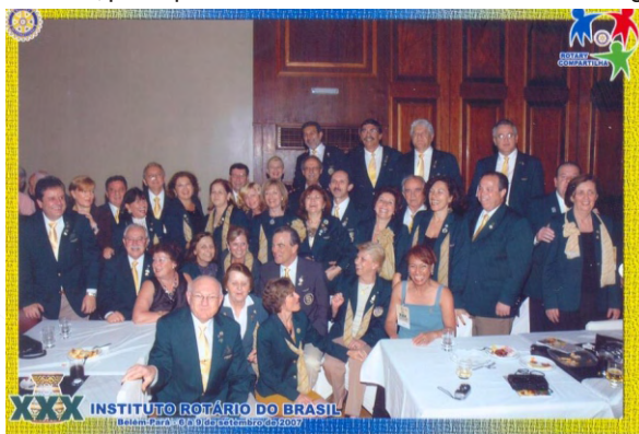
Instituto Rotário do Brasil – Carta de Belém

Caros companheiros, tornando os nossos clubes mais eficazes continuaremos a ser , um grupo de profissionais trabalhando em prol de melhorias, para que o ser humano tenha uma vida mais digna.