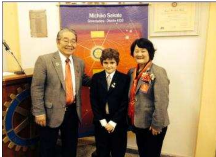
RC CERQUILHO 28/07