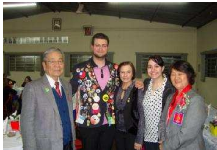
RC TIETÊ 29/07